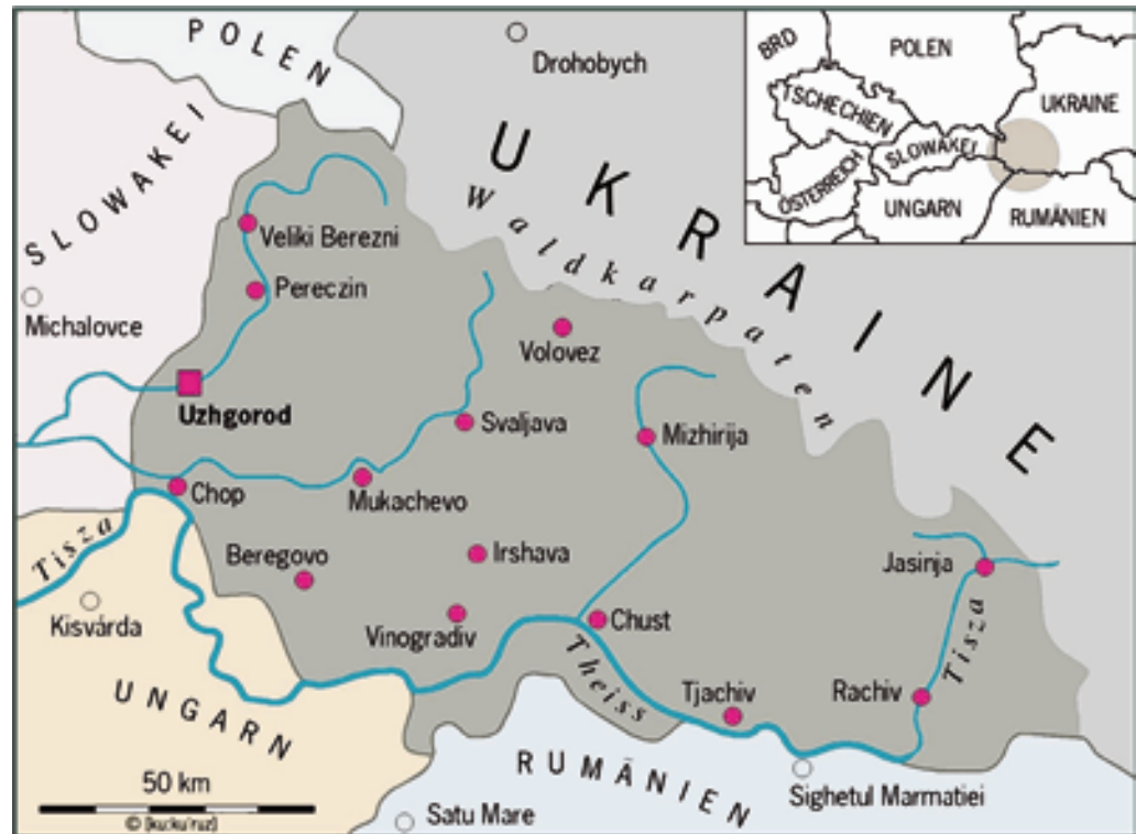
Transkarpatien: Mittelpunkt Europas

Transkarpatien ist die westlichste ukrainische Provinz und liegt im nördlichen Karpatenbogen. Damit befindet sich Transkarpatien exakt im geografischen Mittelpunkt Europas. Die Region zählt 1,28 Mio Einwohner, umfasst mit über 12'800 km 2 rund 2% des ukrainischen Territoriums und hat eine gemeinsame Grenze mit Polen, der Slowakei, mit Ungarn und Rumänien. Die Provinzhauptstadt Ushgorod zählt rund 126'000 Einwohner. Seit 1991 ist die Ukraine ein unabhängiger Staat.